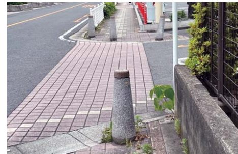
視覚障害者の支障となる車止めボール

健康福祉部長 ②有効な手段の一つであり、今後状況を見ながら総務部と調整し検討する。