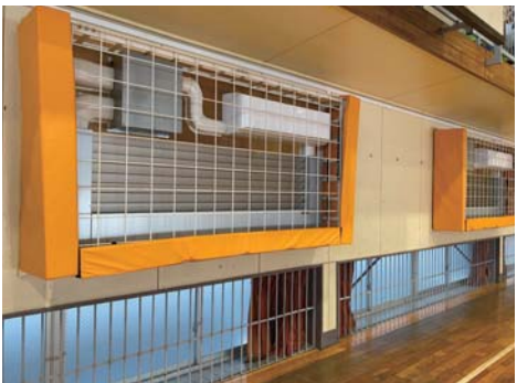
すべての体育館に設置されている空調設備

市民医療センター事務長 実証実験では、公平病院所有のオンライン診療システムと医療機器を搭載した車両を用い、医療が患者の所に向かい診療を行う。ゆくゆくは診療として、医師が患者の背景を踏まえて、予防の必要性を診立て、福祉と連携して、介護予防活動などの社会資源につなげる「社会的処方の仕組みづくり」を進めていく。