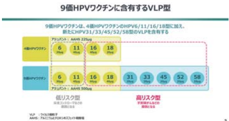
接種が高額になる9価HPVワクチン

議員 9価ワクチンだと88%の型をカバーできることになる。しかし高額かつ自費接種となるため、公費負担を要望する。また、予防と感染症対策のために男性への定期接種も重要である。未来の医療費を抑えるために先行投資として考えてもらいたい。