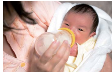
出産後の親子への支援が求められます